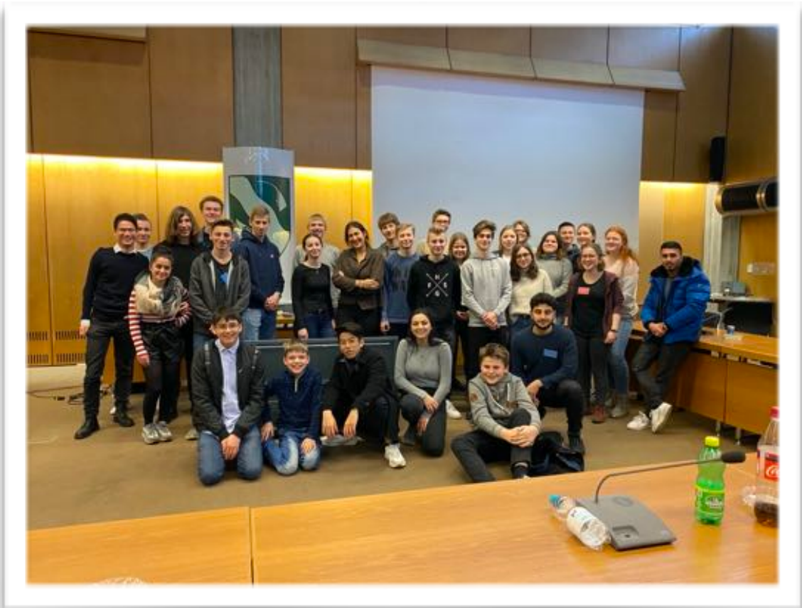
25 BDK Rathaus Emsdetten

142 143 144 145 146 147 148 149 150 151 152 153 154 155 156 157 158 159 160 161 162 163 164 165 166 167 168 169 170 171 172 173 174 175 176 177 178 179 180 181